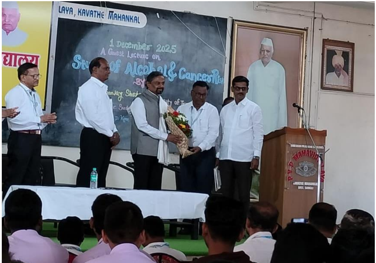
Welcome of Guest